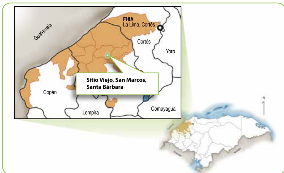
Ubicación geográfica de Sitio Viejo y área de cobertura de la Ruta de Trabajo 5A del Proyecto de Cacao FHIA-Canadá.